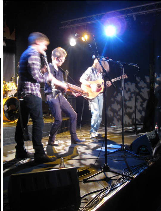
Vilde från Uppsala klöste upp folk på dansgolvet !